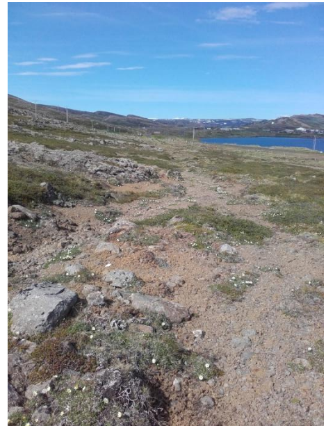
Mynd 2. Gömul leið sem liggur í gegn um svæðið. Horft til Norðurs.