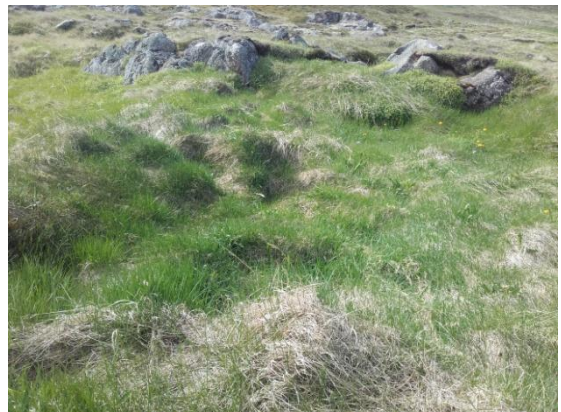
Mynd 1. Rústabuga í forgrunni og réttin sést fyrir aftan. Horft í vestur.