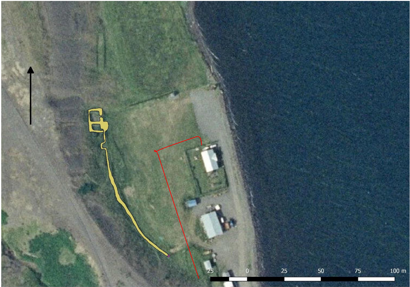
Kort 1. Kortið sýnir garðlagið á Borðeyri ofna við húsið Meleyri og rauða lína er fyrirhugaður ljósleiðari. Kort: MHH