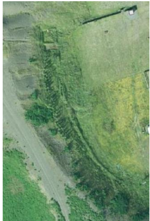
Mynd 2. Mynd sem sýnir túngarðinn úr lofti.

Heimildir: Íslendinga Sögur, II. bindi. Ólavur Ólavíus, Ferðabók.