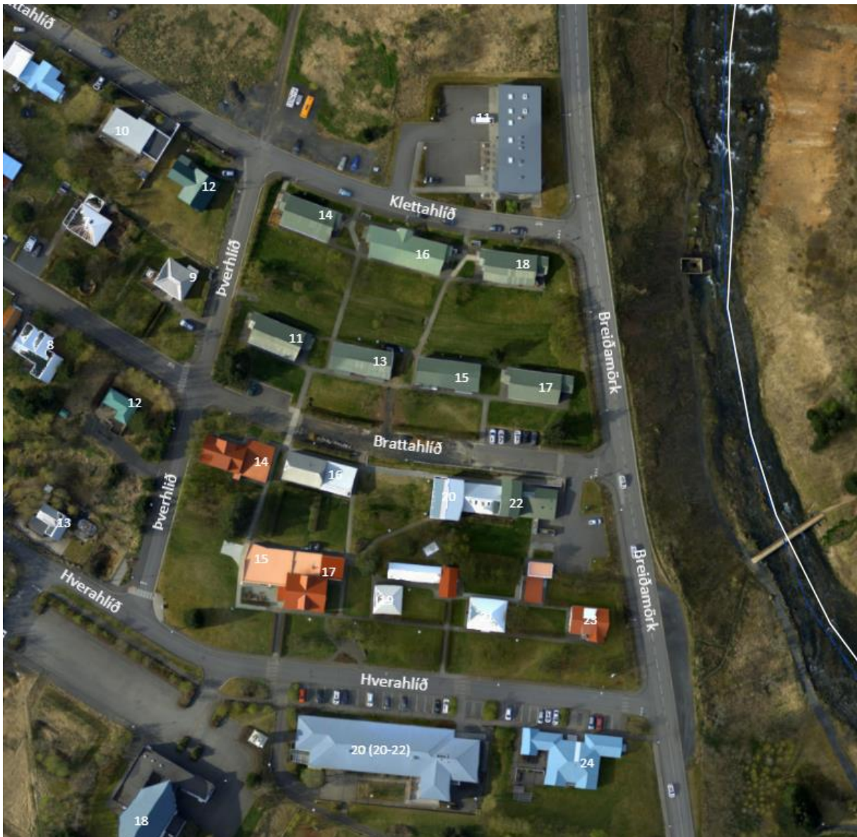
Mynd 1. Myndin sýnir svæðið sem um ræðir milli Kletthlíðar í norður og Hverhlíðar í suður. Þverhlíð til austur og Breiðumörk til austurs.

Svæðið afmarkast af Hverahlíð, Þverhlíð, Kletthlíð og Breiðumörk.