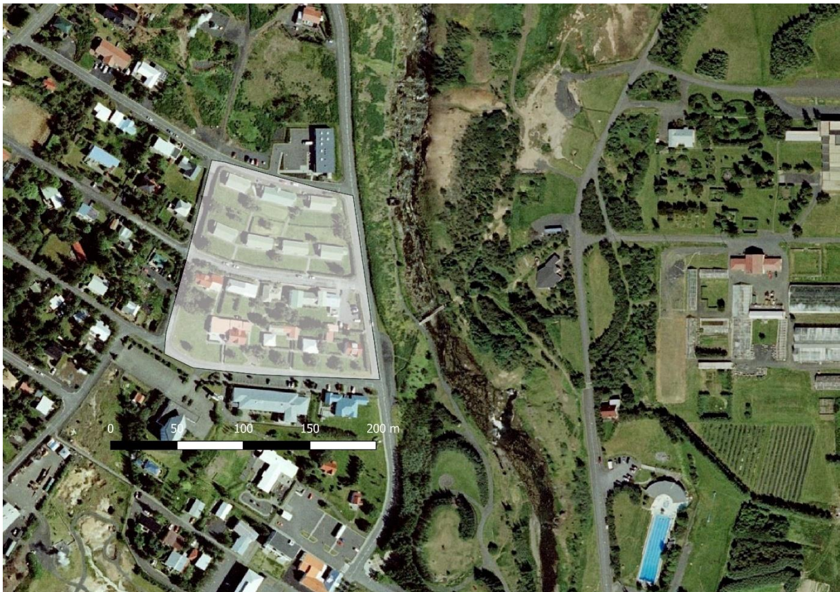
Kort. 1 Kortið sýnir afmörkun deiliskipulagsreitsins