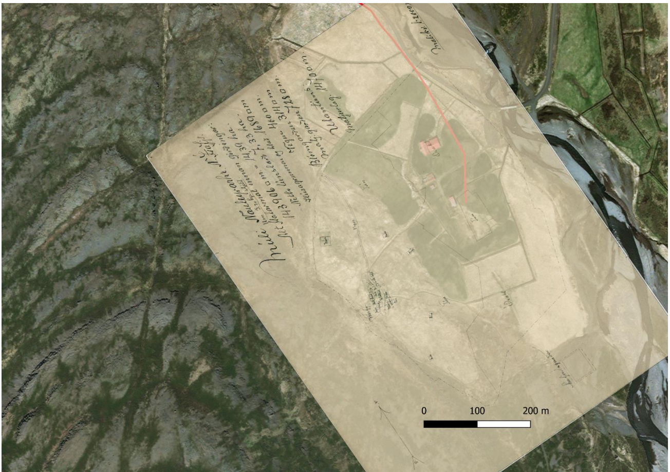
Mynd 2. Túnakort sem lagt hefur verið yfir loftmynd sýnir að þar sem strengurinn liggur var í um 1908 órækt og enginn hús. Loftmynd :Bing.

Þar sem strengurinn liggur frá bænum var á túnakorti frá 1908 skráð órækt og bærinn og útihús tengd honum voru þá mun hærra í túninu en núverandi íbúðarhús. Engar minjar eru í hættu vegna lagningu strengsins í landi Múla.