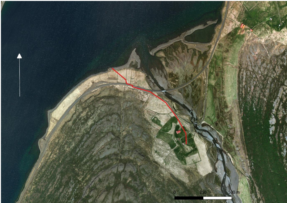
Mynd 3. Loftmynd sem sýnir legu strengsins frá túninu við Múla og að mastri. Loftmynd. Bing