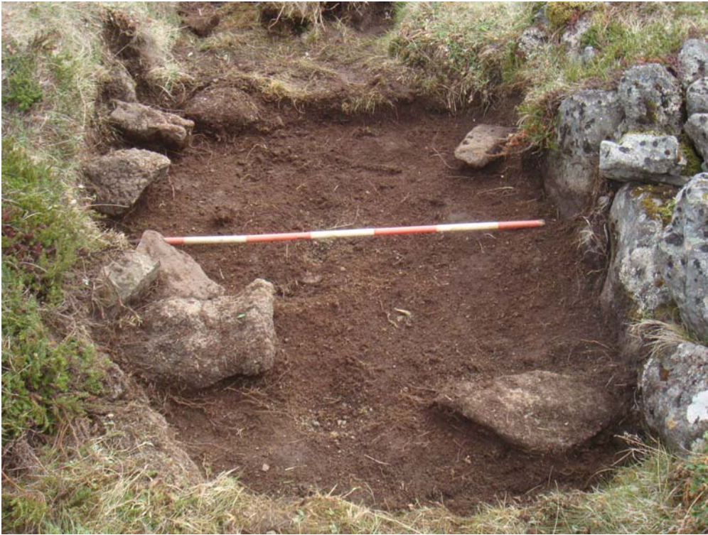
Mynd 1. Lag [2]