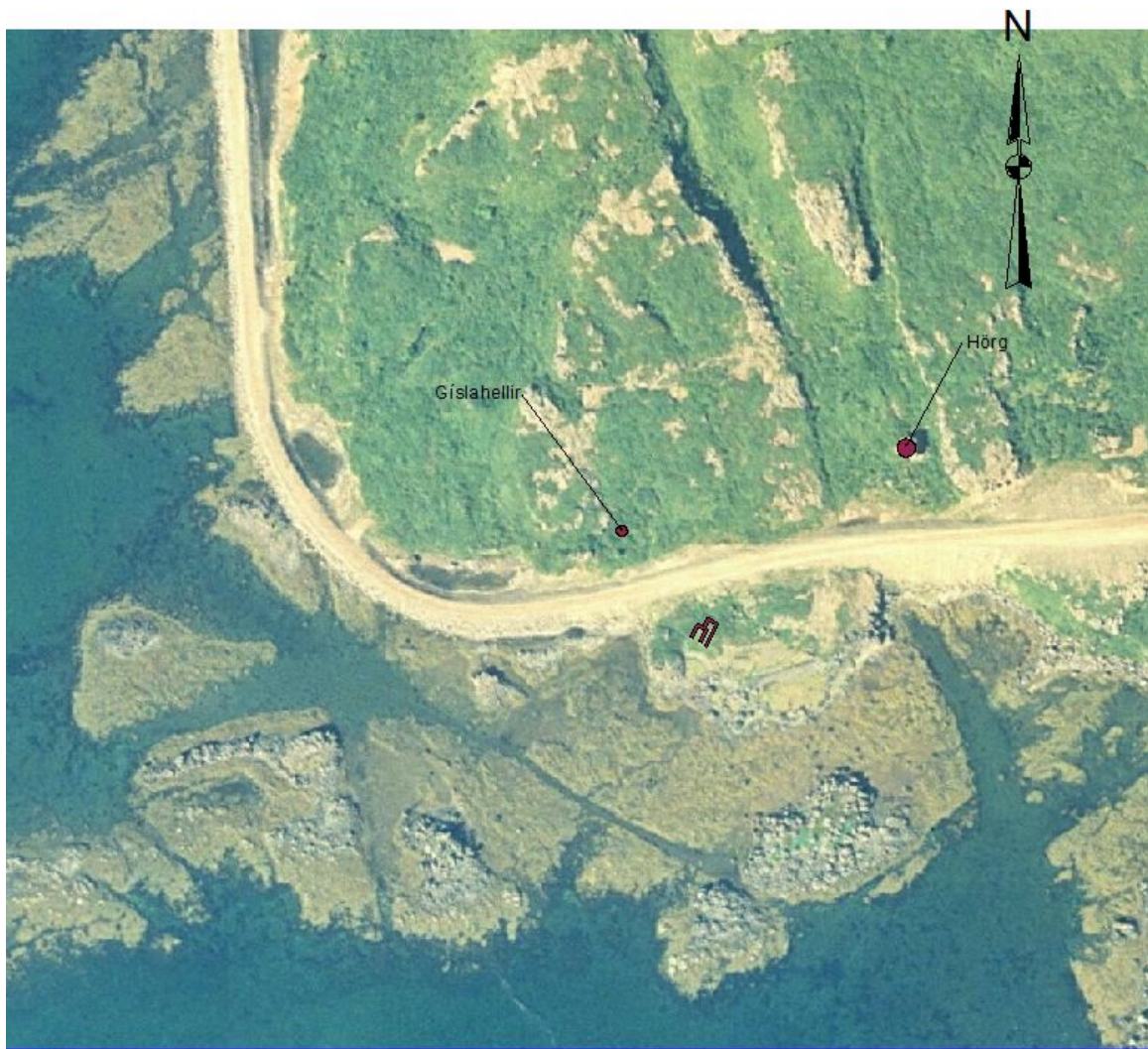
Kort 2. Staðsetning rústarinnar á Hörgsnesi.