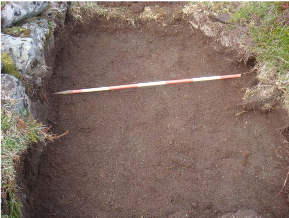
Mynd 2. Lag [3]