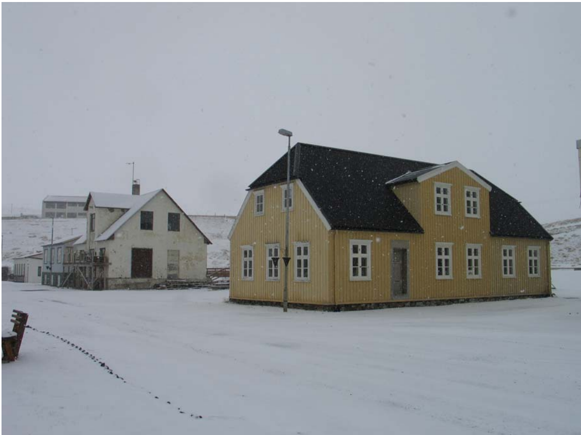
Mynd 1. Riishúsið á Borðeyri.