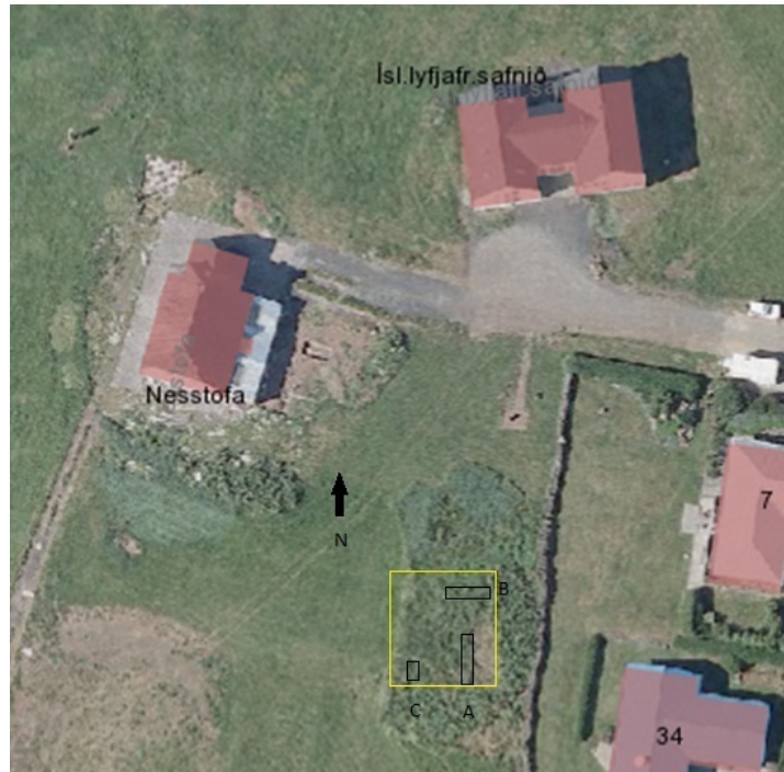
Mynd 1. Guli kassinn sýnir hvar fyrirhugað er að gera urtagarð en svörtu reitirnir eru tilraunaskurðir.