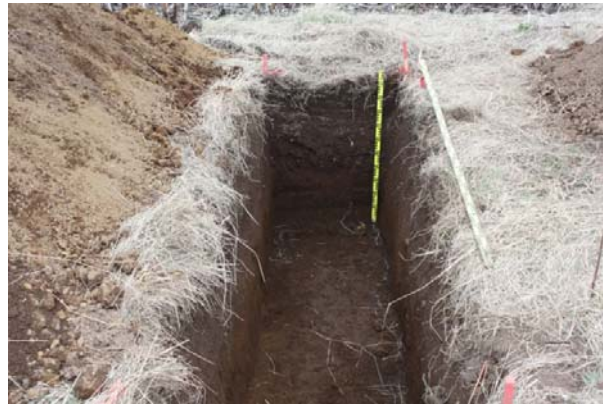
Mynd 2. Könnunarskurður A. Mynd tekin í suður.

Jarðlag # [2] Brúnt hreyft jarðlag, greinilega uppstunginn kálgarður. Mikið ormétinn. Nokkuð af smásteinum. Neðst í þessu lagi fór að koma upp mikið af rusli, sérstaklega beinum.