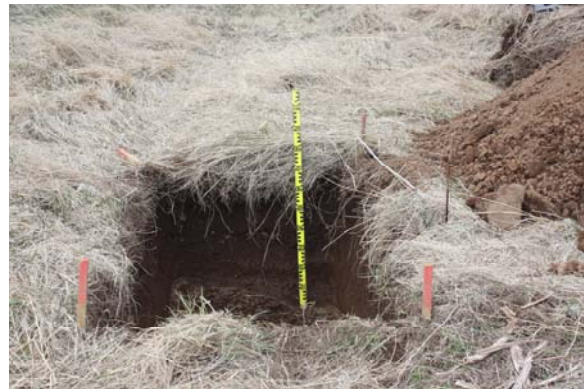
Mynd 5. Skurður C, mynd tekin í vestur.

Jarðlag # [1] Brúnt lag, sama og í A og B, mjög hreyft. Mikið af beinum og nokkrir gripir (sjá gripaskrá aftar). Náði niður á 70 cm. Ekki var talið nauðsynlegt að grafa skurðinn dýpri.