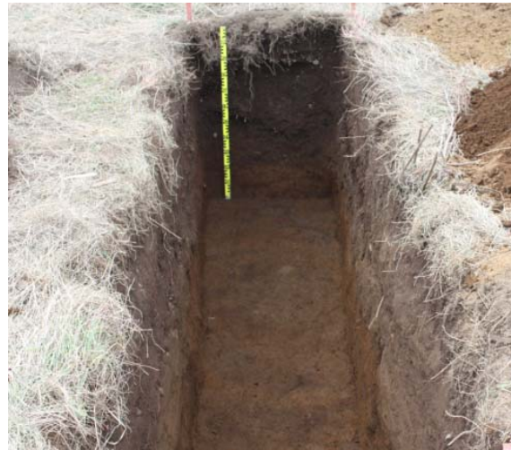
Mynd 3. Könnunarskurður B. Tekið í vestur.

Jarðlag # [9] Óhreyfður sjávarbotn, mikið af smágrjóti, finnst um allt svæðið.