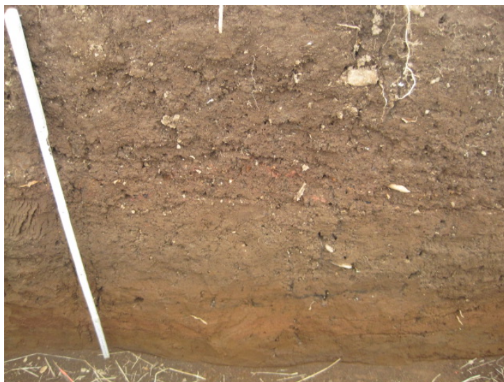
Mynd 4. Snið í skurði B.