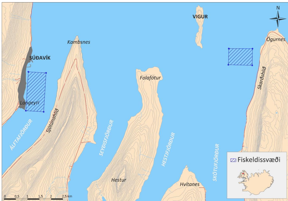
Kort 2. Staðsetning fiskeldissvæða á árgangasvæði 1 (kort Nave).