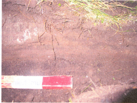
Mynd 1. Norðursnið, nærmynd.

Undir yfirborðslagi [1] var veggur rústarinnar og var hann hlaðinn úr grjóti með torfi á milli [7]. Undurstöður veggjarins voru úr torfblönduðu efni [6] sem mokað hafði verið upp. Beggja vegna veggjarins var rötarkennd fokmold [2], [4] sem lá upp að veggnum. Undir [2]