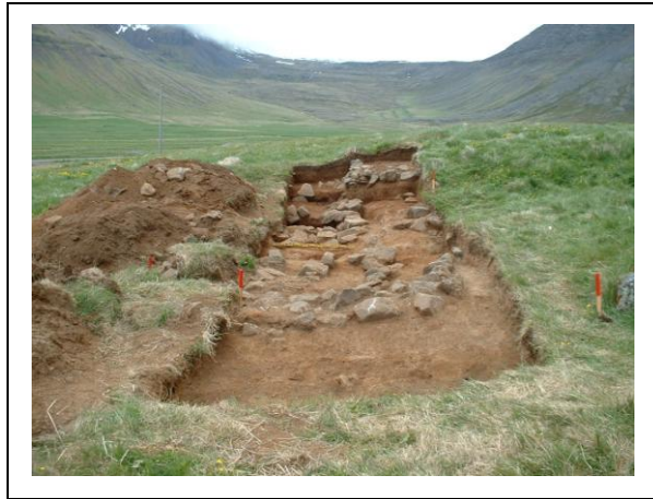
Mynd 1. Rúst í skurði 3.

Undir þessum vegg var talsvert uppkast blandað af torfi og mold. Undir uppkastinu var torfblönduð mold sem var líkust torfhruni úr veggjum eða þaki. Þegar hrunið hafði verið fjarlægð komu í ljós veggir úr torfi og grjóti. Veggirnir voru hlaðnir að innan og utanverðu með grjóti en torf sett á milli þeirra. Þessir veggir tilheyrðu byggingu sem var 9 metra löng og um 5 metrar á breidd. Byggingin var með tvö herbergi og á einum stað sáust merki um stoðarholu sem benda til þess að þak hafi verið yfir byggingunni. Veggir byggingarinnar voru illa farnir og ástæða þess var að grjót hafði einhvertímenn verið tekin úr veggjunum í þeim tilgangi að nota þá annarstaðar.