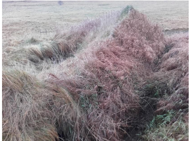
Mynd 3. Rúst. Þakið stendur að hluta en rústin er að mestur hrugin saman.

Staðhættir Við norður enda golfvallarins er úthús sem grafið hefur verið inn í hólinn.