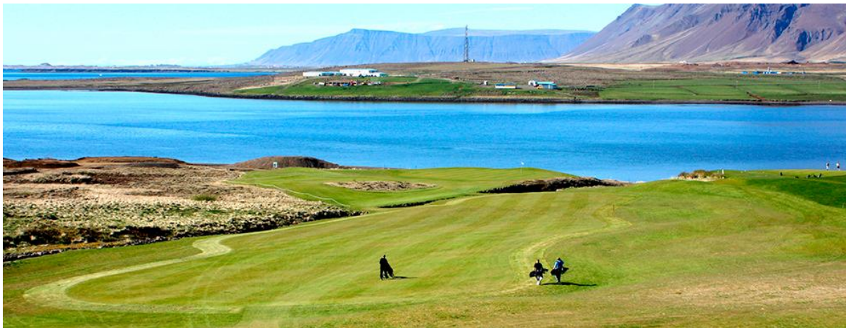
Mynd 1. Til vinstri á myndinni sést órækt, þar er bæjarhóll Svarfhóls líklega óraskaður.