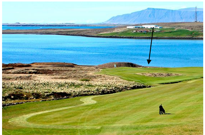
Mynd 2. Ljósmynd af golfvöllinum. Örin bendir á rústabungu þar sem útihús hefur líklega staðið.