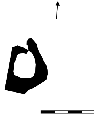
Teikning 3. Rétt sem byggð er við klett. Beina línán á vinstri hlið réttarinnar er kletturinn.