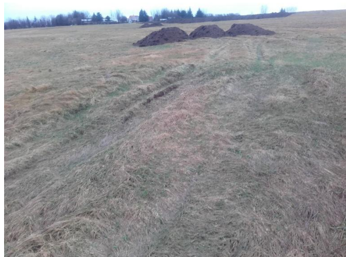
Mynd 5. Hjólför eftir þunga bíla hafa skemmt rústahólinn sem sést fermst á myndinni.