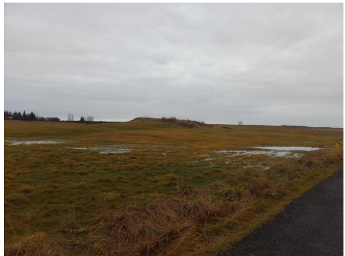
Mynd 4. Bæjarhóll Moshóls tekið í austur.

nú“ 20 . Moshóll stendur 30 m frá veginum heim að golfvellinum.