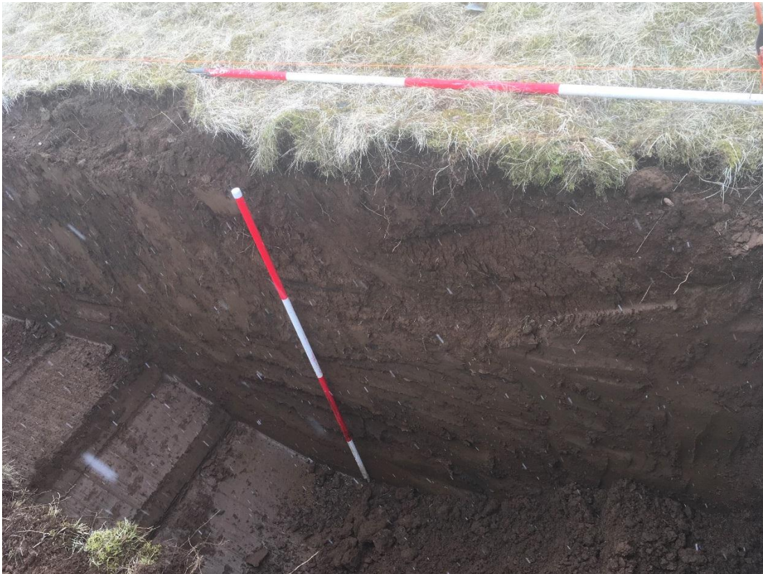
Mynd 2. Dýpt skurðarins var 2 m engin mannvistarlög fundust í skurðinum. Tekið í SA.