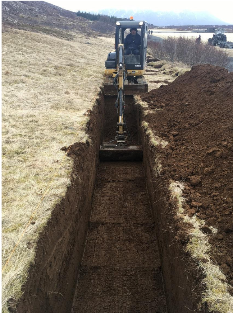
Mynd 1. Skurðurinn var grafin með lítilli gröfu. Tekið í A.

Grafin var 20 m langur skurður með stefnuna (NNA-SSV) breidd hans var 1,2 m og dýpt 2 m.