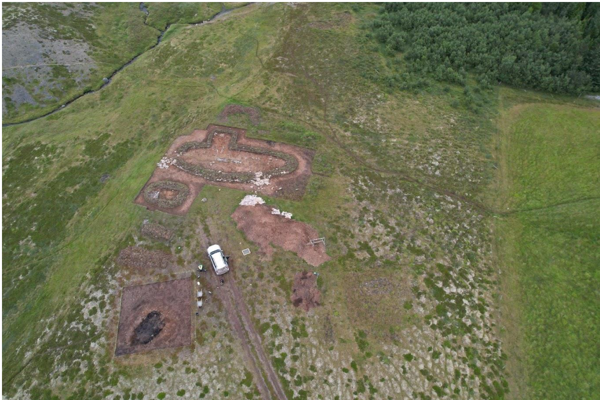
Mynd 6. Myndin sýnir afstöðu húsanna á Auðkúlu. Neðst er húsið sem var grafið, ofan við það er smáhúsið (jarðhúsi) og svo skálinn. Til hægri við slóðann sést grilla í bænhúsið og kirkjugarðinn.

Þrjár stoðarholur voru grafnar að fullu ([805], [807] og [809]) en ekki gafst tími til að grafa hinar sex. Stoðarhola [805] var 32 cm í þvermál og 13 cm djúp. Fylling stoðarholunnar [806] var kolablönduð svört silt með pökkunarsteinum. Stoðarhola [807] var 37 cm að lengd, 30 cm að breidd og 10 cm djúp. Fylling stoðarholunnar [808] var kolablönduð svört silt með tveimur pökkunarsteinum. Stoðarhola [809] var hringlaga og fyllt með lausum malarkenndum jarðvegi [810].