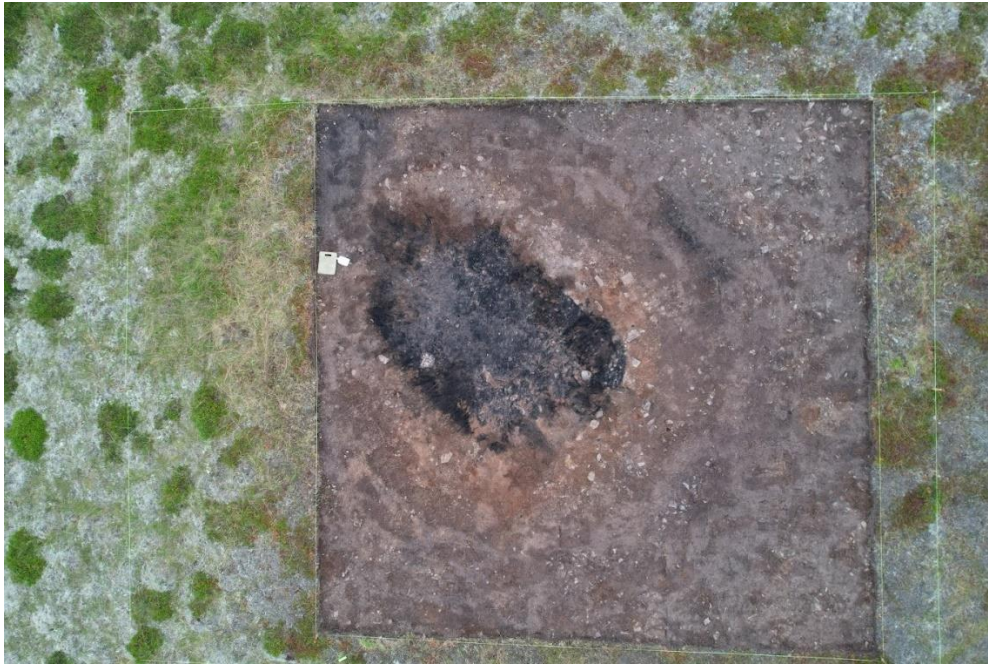
Mynd 4. Myndin sýnir húsið með svörtu gólfi og lagið sem myndar útlínur veggja.

Stærð þess svæðis sem opnað var yfir litlu byggingunni sunnan við skálann og smáhýsið var í fyrstu 7 x 9 m að stærð en síðar stækkað í 10 x 9 m (90 m 2 ). Byggingin var mjög grunnt undir yfirborðslaginu og ætla má að 3 rúmmetrar hafið verið grafnir ofanaf.