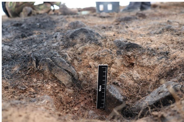
Mynd 5. Ein af stoðarholum byggingarinnar.

Byggingin var mjög grunnt undir sverði, svo grunnt að gæta var ýtrustu varkárni við aftyrfinngu. Efst var þunnt yfirborðslag [801] og strax þá birtist lag [802] sem virtist móta lag byggingarinnar og var frekar gróf mól, mjög lík því náttúrulegu yfirborði sem byggingarnar eru byggðar ofnaá. Ekkert torf fannst í þessu