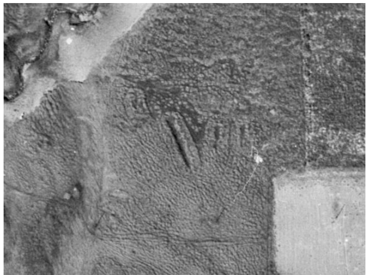
Mynd 2. Á gamalli loftmynd sjást þrjú hús á járnvinnslusvæðinu en þrjú þeirra eru komin undir tré. Könnunarskurður sem gerður var í eitt þeirra bendir til tengingu við járnvinnslu. Húsin eru órannsökuð.