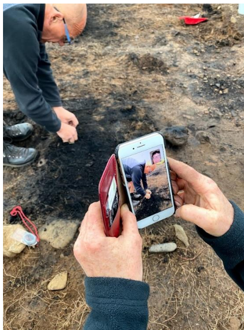
Mynd 8 t.v. Sýni tekið úr gólfagi. T.h Prófessor í Bradford leiðbeinir nema í gegn um síma um sýnatöku