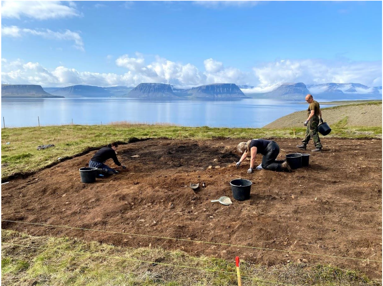
Mynd 3. Unnið við rannsókn hússins á fallegum sumardeg

Allar teikningar voru handteiknaðar á teikniplast í hlutföllum 1/20 og hæðir teknar með venjulegum hæðamæli. Hnit voru skráð á öllum staurum með Trimble Juno 5 uppmælingatæki. Eigið hnitakerfi (grid) var sett upp á XY ás sem notast við landsnets hnitakerfið ÍSNET93. Um 90% af gólfinu var tekið í sýni. Ljósmyndir voru teknar á Canon EOS 650 með 18/55 mm linsu og skráð í ljósmyndaskrá. Vinnu myndir voru teknar á síma og spjaldtölvu.