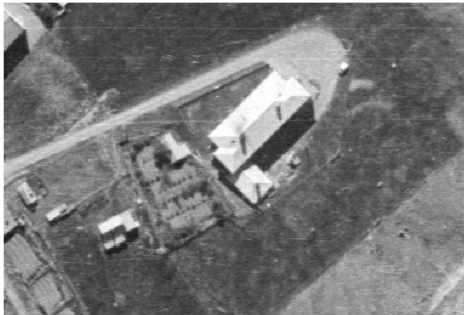
Mynd 2. Loftmynd frá 1958 sem sýnir garðinn, viðið hlið sjúkrahússins spítalans . Landmælingar Íslands.

Mynd 1. Garðlagið á lóð sjúkrahússins spítalans .