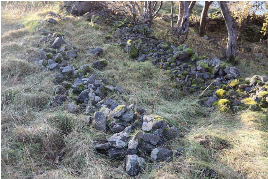
Mynd 5. Lítið hólf við NA hlið.

Formatted: Space After: 6 pt, Line spacing: single