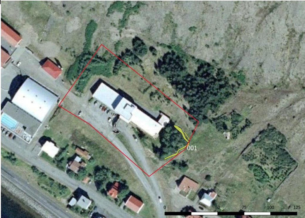
Mynd 6. Myndin sýnir innmælingu á garðinum og svæðið sem skoðað var. Ofna við spítalann-sjúkrahúsið er í dag búið að reisa ofnaflóða varnirgerð .