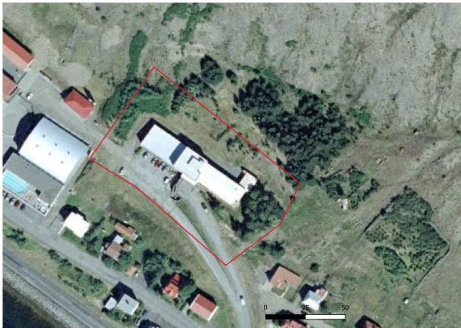
Kort 1. Kortið sýnir með rauðu það svæði sem rannsakað var.

Númerin eru fengin frá kortasjá Minjastofnunar Íslands. Hvert verkefni er afmarkað og hlýtur sérstakt númer sem í þessu tilfalli er númerið 2742 . Sjá má afmörkun þess svæðis sem skráð var inn á kortasjá Minjastofnunar https://www.map.is/minjastofnun/ . Hver fornleif hlýtur síðan hlaupandanúmer dæmi: verkefnanúmer 2742-1 .