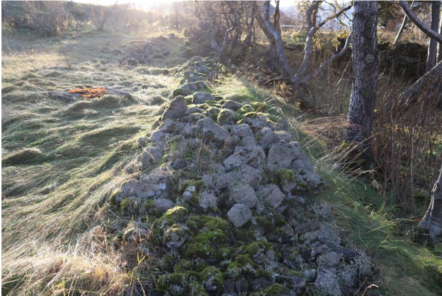
Mynd 4. Efri skammhlið garðsins sem liggur NV-SA tekið í SA.

Formatted: Space After: 6 pt, Line spacing: single