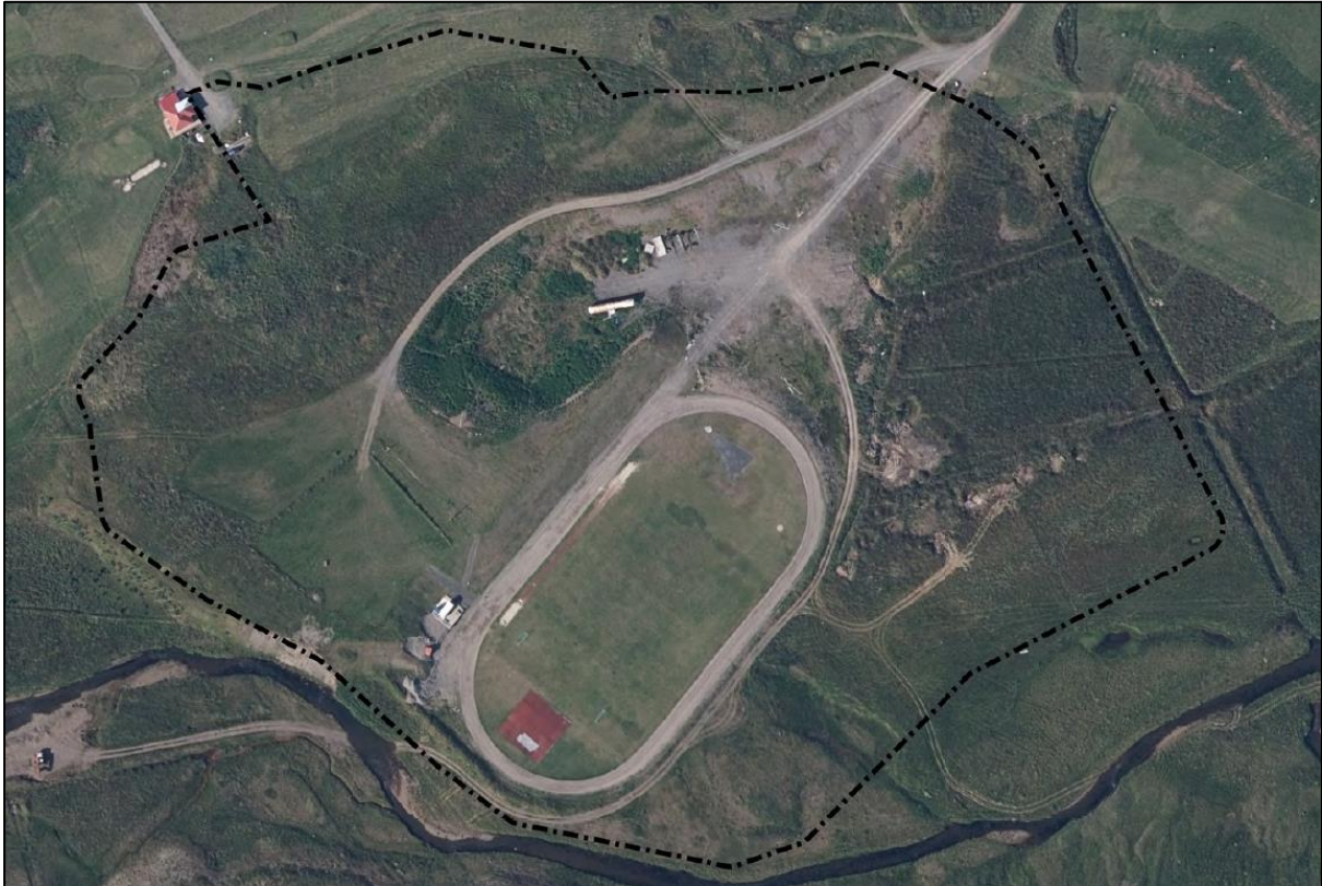
Mynd 2 - Mörk skráningarsvæðisins eru merkt á loftmynd með svartri punktalínu.